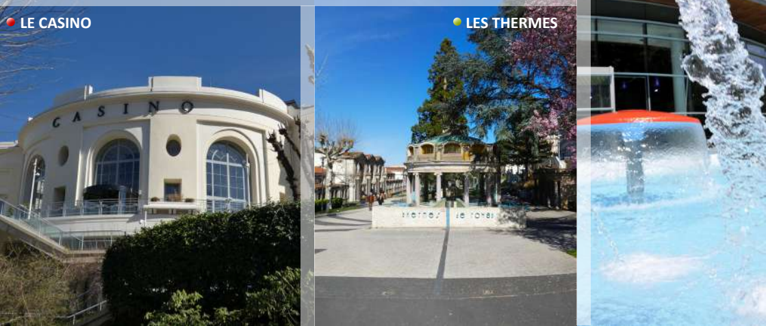
● LES THERMES