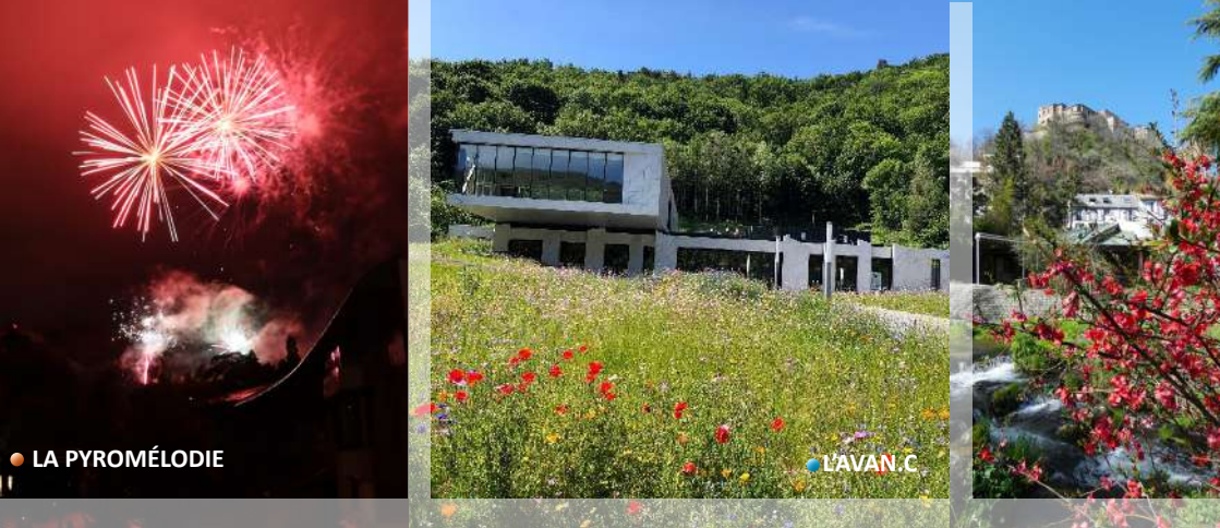
● LA PYROMÉLODIE